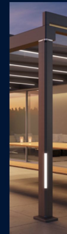
LED-Beleuchtung im Pfosten unten