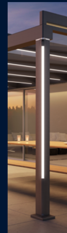
LED-Beleuchtung im Pfosten oben

Setzen Sie Ihre Terrasse spektakulär in Szene! Mit den hochwertigen Farb-LED-Bändern, integriert in Pfosten und Dachträger, geben Sie Ihrer Terrasse effektvolle Akzente.