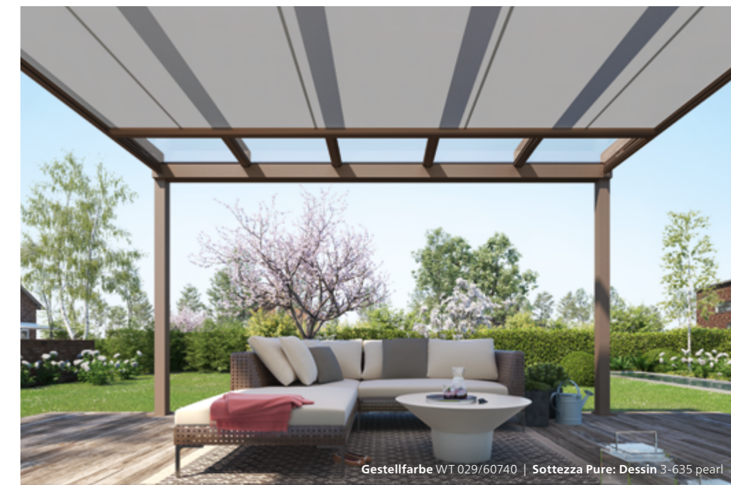
Gestellfarbe WT 029/60740 | Sottezza Pure: Dessin 3-635 pearl

Ein angenehmes Klima auf Ihrer Terrasse verspricht die Wintergarten-Markise Sottezza Pure . Der dekorative Sonnenschutz ist formschön, schlank, zurückhaltend – und pflegeleicht. Denn Sottezza Pure ist unter dem Terrassendach angebracht. Das schützt sie vor Feuchtigkeit und Schmutz, das Tuch bleibt attraktiv und sauber.