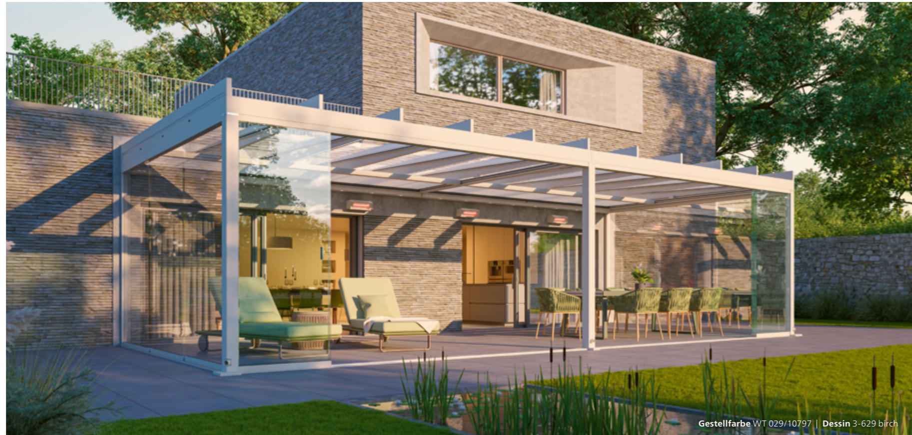
Gestellfarbe WT 029/10797 | Dessin 3-629 birch

Größe des abgebildeten Terrassendachs: 9,5 x 3,5 m