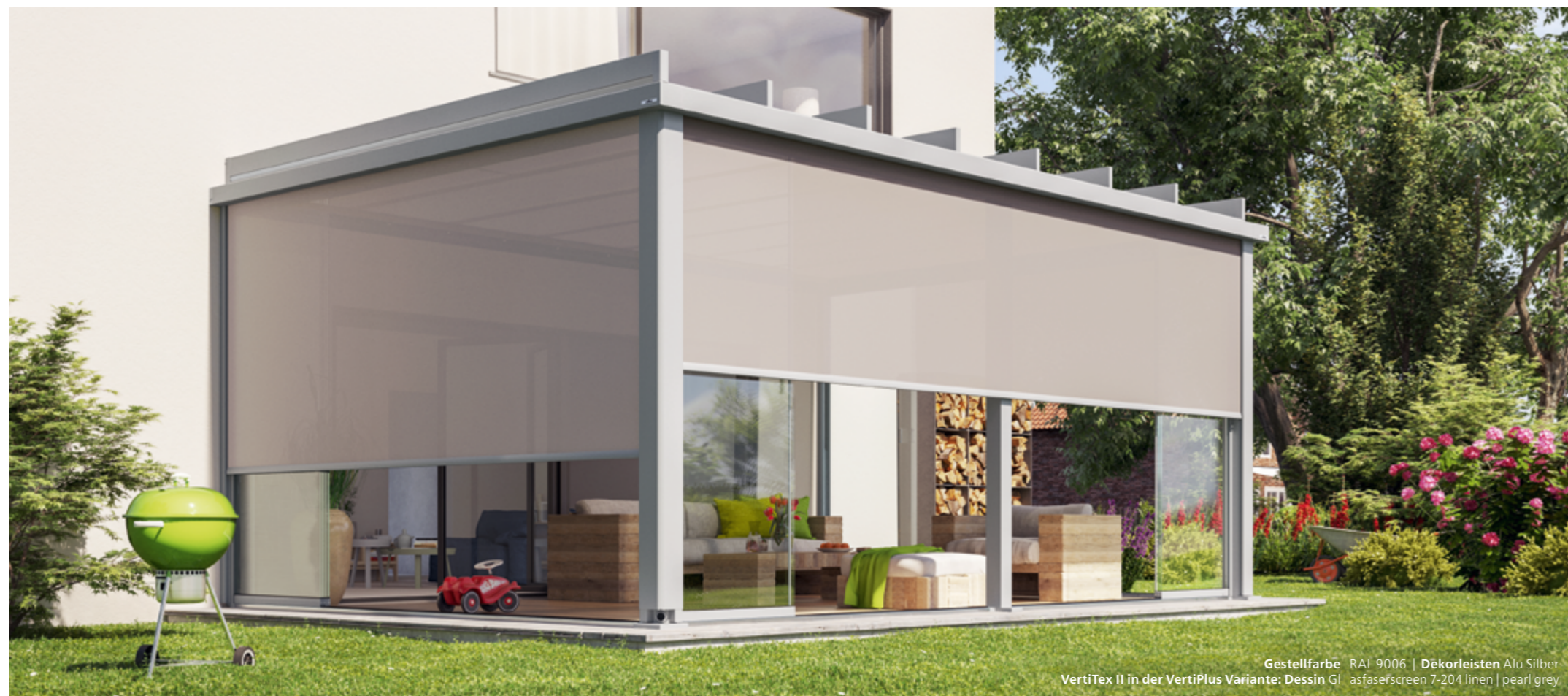
Gestellfarbe RAL 9006 | Dekorleisten Alu Silber VertiTex II in der VertiPlus Variante: Dessin GI asfaserscreen 7-204 linen | pearl grey

Sie möchten von den Seiten und von vorne vor Blicken und blendendem Licht geschützt sein? Dann ist die Senkrecht-Markise VertiTex II von weinor die richtige Wahl. Die speziell für VertiTex II entwickelte Kollektion screens by weinor® umfasst eine große Auswahl an hochwertigen Tüchern. Und das patentierte weinor Opti-Flow-System® gewährleistet einen optimalen Tuchstand. VertiTex II für Terrazza Pure gibt es auch in der optisch attraktiven VertiPlus Variante mit Design-Blenden.