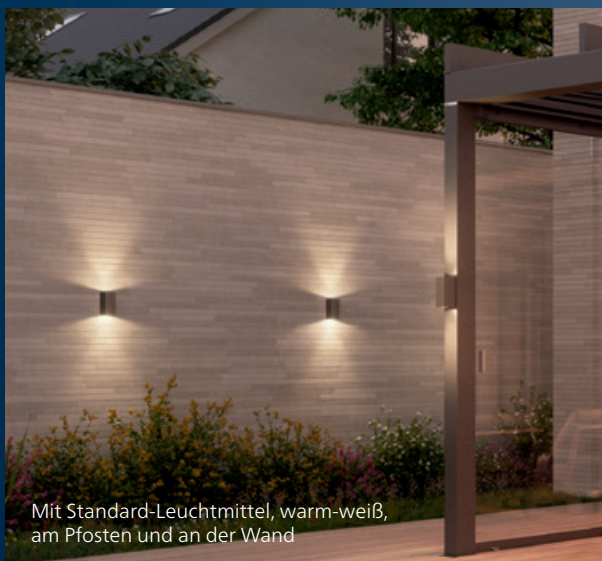
Mit Standard-Leuchtmittel, warm-weiß, am Pfosten und an der Wand