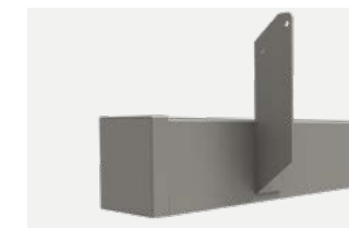
Pose sur chevrons

Large choix de couleurs de structure et de toiles, pour un store qui correspond parfaitement à votre architecture et à votre style. Pour en savoir plus, rendez-vous sur : weinor.fr/architecture-ambiance