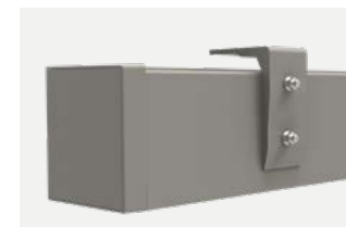
Pose au plafond