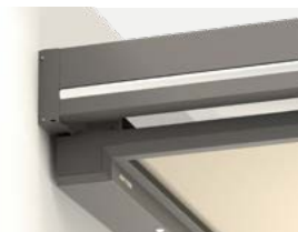
Sottezza Pure inséré