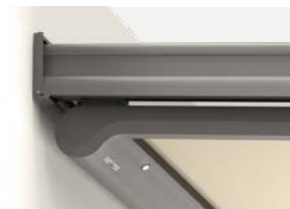
Sottezza Pure inséré

Large choix de couleurs de structure et de toiles, pour un store qui correspond parfaitement à votre architecture et à votre style. Pour en savoir plus, rendez-vous sur : weinor.fr/architecture-ambiance